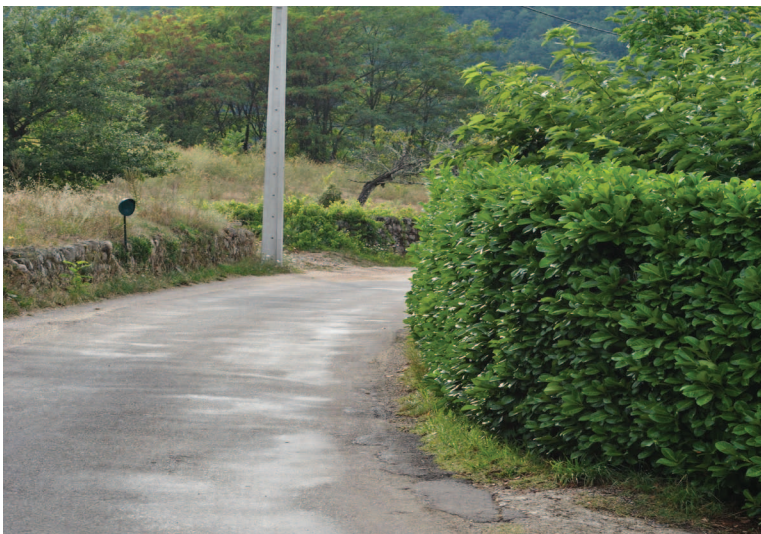
Un exemple à ne pas suivre !

Pour un arbre, la jurisprudence considère que la mesure doit être effectuée à partir du centre du tronc, pris au niveau du sol.